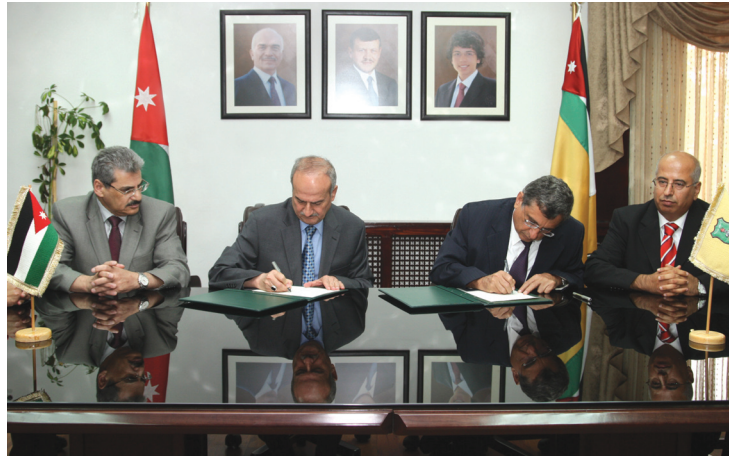
توقيع مذكرة تفاهم

يشار إلى أن "الأردنية" تستقبل سنوياً طلبة أتراكاً للدراسة في كلياتها إلى جانب انضمام بعضهم لتعلم اللغة العربية في برامج المعهد الدولي لتعليم اللغة العربية للناطقين بغيرها .