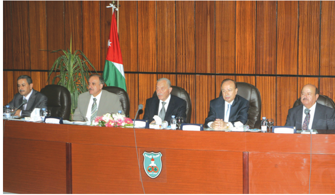
جانب من ندوة العنف في أقسام الطوارئ

العلاج والاختلاف والتعامل مع الطاقم الصحي على العلاج وتفصيل التأمين الصحي. وكشف الدكتور القضاة النقاب عن وقوع ثلاث حالات عنف في طوارئ مستشفى الجامعة خلال الخمس سنوات الماضية تم حلها دون اللجوء إلى المراكز الأمنية مؤكداً في هذا الصدد الجهود التي تبذلها إدارة المستشفى للاهتمام